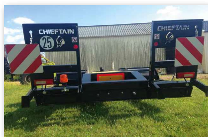
Plaques rouge et blanche + gyrophare