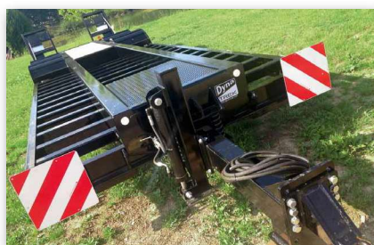
Béquille hydraulique – attelage réglable en hauteur de série

* Roues jumelées en standard / Roues pleines non jumelées en option