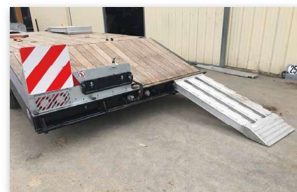
Rampe amovible aluminium